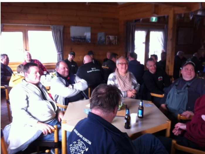
De Gorinchemse tafel

Aan alle goede dingen komt een eind, tijdens de wedstrijd van 12 feb werd nog slechts 1,1 Kg gevangen. Hierbij moet aangetekend worden dat in de week voorafgaand aan de wedstrijd er plotseling aalscholvers in de haven werden gesignaleerd. Misschien dat dat deze kregen verantwoordelijk waren voor het verdwijnen van de vis ??