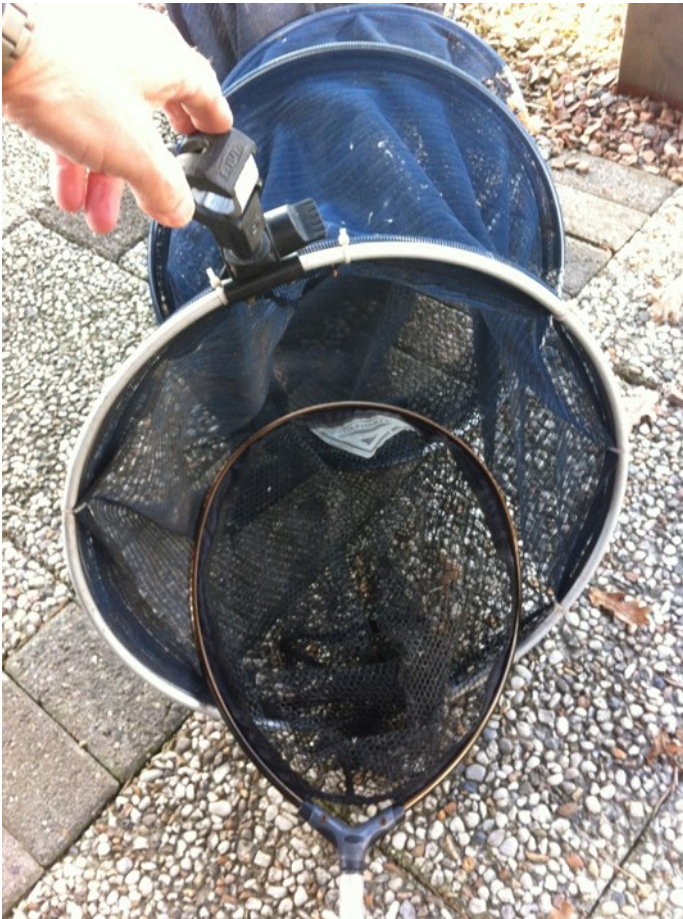
Een smal schepnet past makkelijk in het leefnet.