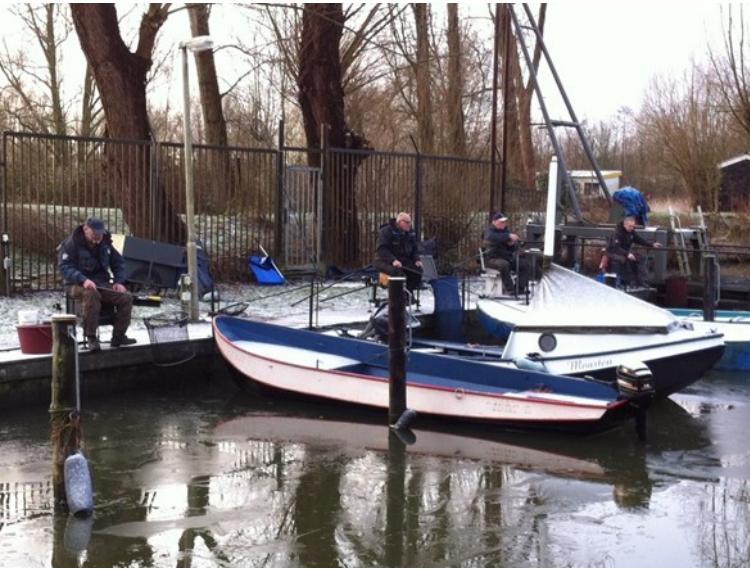
Hier zitten de mannen die tussen het ijs een visje proberen te verschalken.