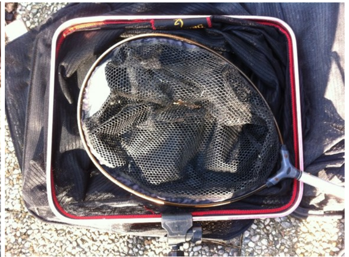
Ook in een rechthoekig leefnet