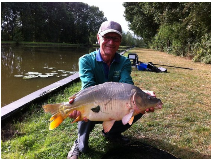
mooie karpers, maar hoeveel kunnen er nog bij?

De sterfte in het voorjaar betrof tenminste 67 karpers, voornamelijk in maart en zo'n 54 brasems in april. De veronderstelling is dat er meer vissen dood zijn gegaan dan dit geregistreerde aantal. Naar schatting is ongeveer 300 Kg dood en dat is iets meer dan vorig jaar. Komend jaar willen we weer gaan uitzetten, maar de vraag is natuurlijk hoeveel van wat?? Wat we eigenlijk niet willen is dooie vissen verwijderen. Het is een triest karwei en in feite begraven we een flink bedrag. Het bestuur vraagt alle betrokkenen mee te denken en hun mening kenbaar te maken. SVN raadt overigens het uitzetten van brasems af vanwege de grote sterfte na de uitzettingen en de vermindering van de brasemstand in Nederland in het algemeen. De situatie in de kleine put laat enigszins te wensen over. De dode karpers worden volgens SVN verklaard door het extreme voorjaar. De temperatuur bleef lange tijd op een niveau waarbij het voorjaarsvirus zijn werk kon doen. Voor het komende winterseizoen kunnen we hier een kleine aanvullingsuitzetting van karpers doen om het huidige verlies te compenseren. Voor vissers in de kleine put is het duidelijk dat de voorn het in de karpersput ook prima doet. Als de karpers weer eens wat minder bijten kun je altijd nog een voortje vangen. Zo maar vis uitzetten is niet aan de orde. We willen zo min mogelijk dooie vis en zo veel mogelijk vis in het leefnet. In oktober komt de visstandcie bij elkaar en gaat het bestuur adviseren. Er wordt veel wijsheid verwacht.