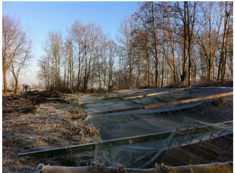
De EBI afgelopen winter nog in bedrijf