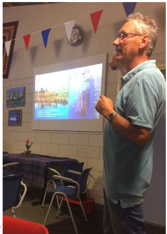
en ook naar onze eigen voorzitter

De gasten kregen uitleg over het reilen en zeilen van 't Stekelbaarsje. De meeste gasten waren onder de indruk van onze geweldige vereniging.