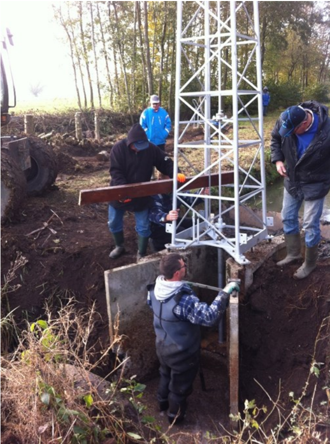
De Molen wordt op de draadeinden gezet