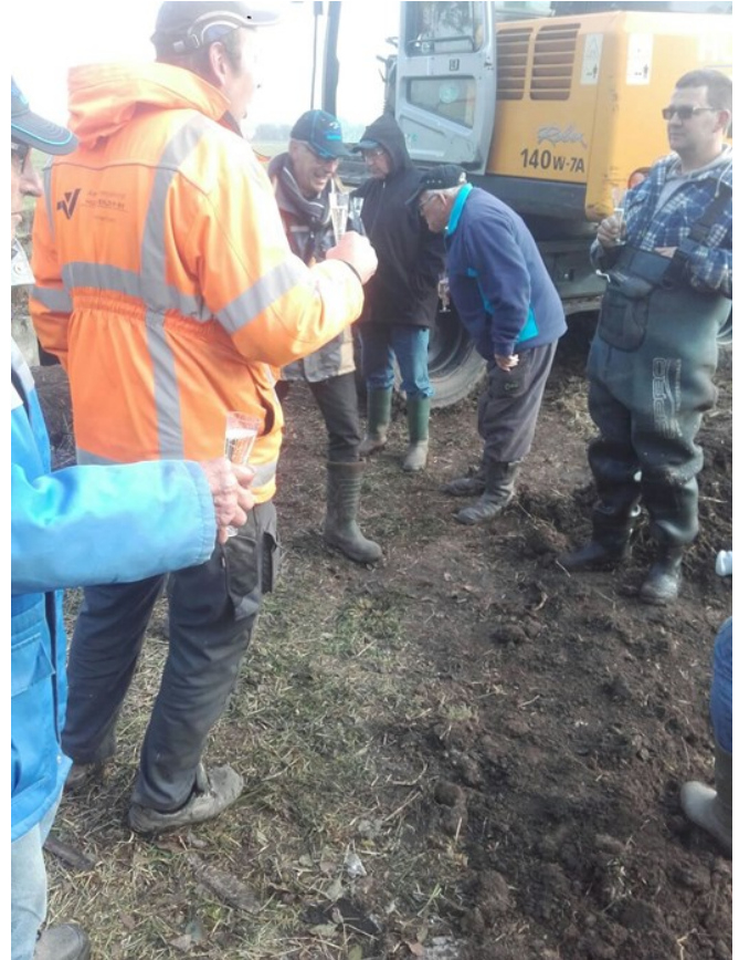
Het glas wordt geheven !!