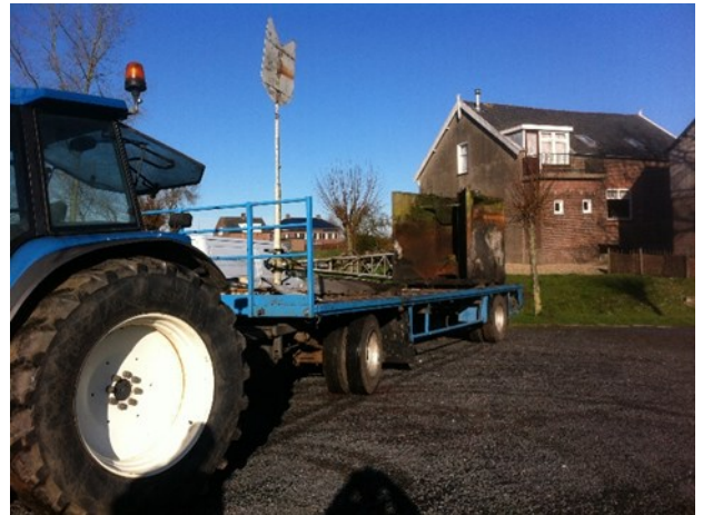
Op de wagen naar Arkel