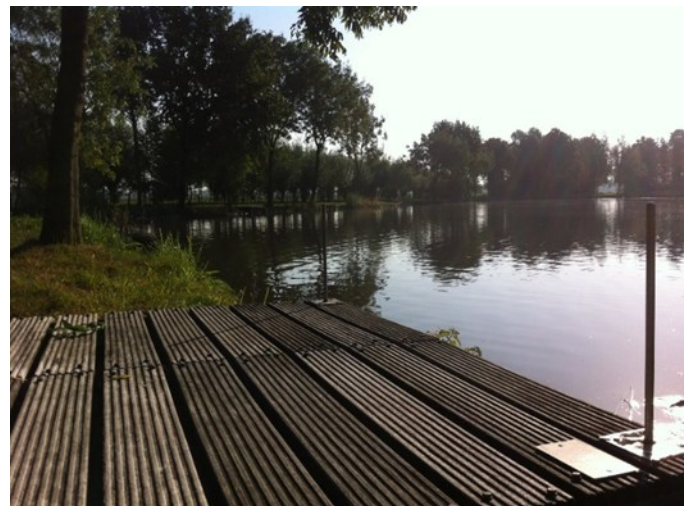
De nieuwe steiger 3

Bij het schrijven van dit stukje is hij al gevorderd tot steiger 23. Het zet er naar uit dat hij in zijn eentje doorwerkend met af en toe een helpend handje, komend voorjaar alle belangrijke steigers vervangen heeft. De steigers op de oostelijke kop van de put moeten nog even wachten. Damian (stagiair) is bezig met het ontwerpen van een plan voor natuur- en visvriendelijke oevers in dat gebied. In dat plan zullen de steigers 15, 16 en 17 integraal meegenomen worden.