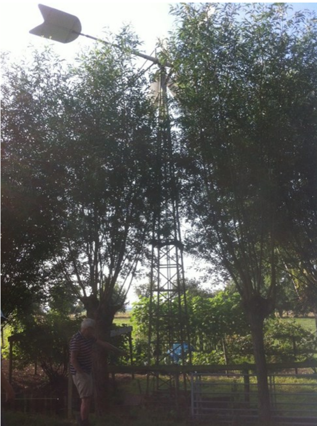
Hier staat de molen nog in Meerkerk

't Is al weer 2 jaar gelden dat 't Stekelbaarsje werd verblijd met de aankondiging van het Waterschap dat er in Meerkerk een watermolen "over" was. In de nieuwsbrieven daarna heeft er steeds een update bestaan, dus iedereen is waarschijnlijk op de hoogte van het traject dat we doorgegaan zijn. Hierbij de gang van zaken in foto's: