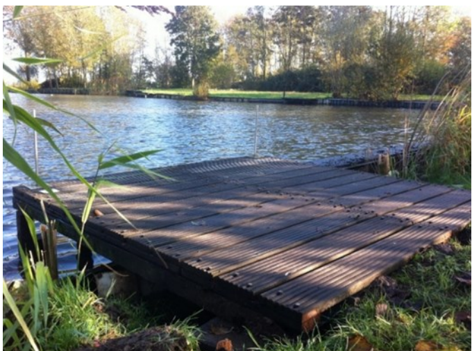
De nieuwe steiger 19

Bij het schrijven van dit stukje is hij al gevorderd tot steiger 23. Het zet er naar uit dat hij in zijn eentje doorwerkend met af en toe een helpend handje, komend voorjaar alle belangrijke steigers vervangen heeft. De steigers op de oostelijke kop van de put moeten nog even wachten. Damian (stagiair) is bezig met het ontwerpen van een plan voor natuur- en visvriendelijke oevers in dat gebied. In dat plan zullen de steigers 15, 16 en 17 integraal meegenomen worden.