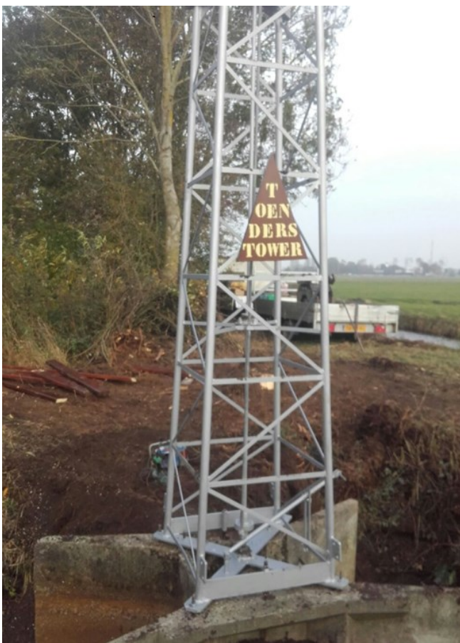
En de Toenders Tower is een feit !!

De molen draait nu sinds 12 november en we kunnen nu al zeggen dat het een groot succes is! Wanneer het een beetje waait draait ie al en wanneer het hard waait, kolkt het water naar binnen. Ook dit is weer een maatregel die de draagkracht van onze vijver gaat verhogen, dus we gaan in de toekomst nog meer vangen.