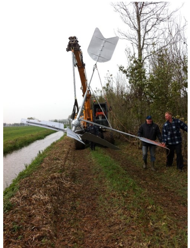
De watermolen wordt naar zijn plaats gebracht