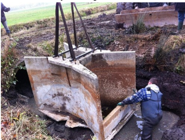
De betonnen onderbak wordt geplaatst