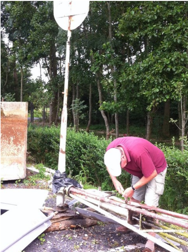
Chris hard aan't krabben en schilderen