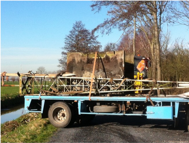
En hier ligt ie voorlopig op de parkeerplaats.