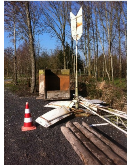
Hier ligt de watermolen op de aanhangwagen.

En jawel dat hielp, want op 24 februari werd ons de watervergunning toegekend. De belangrijkste zinnen uit de vergunning: