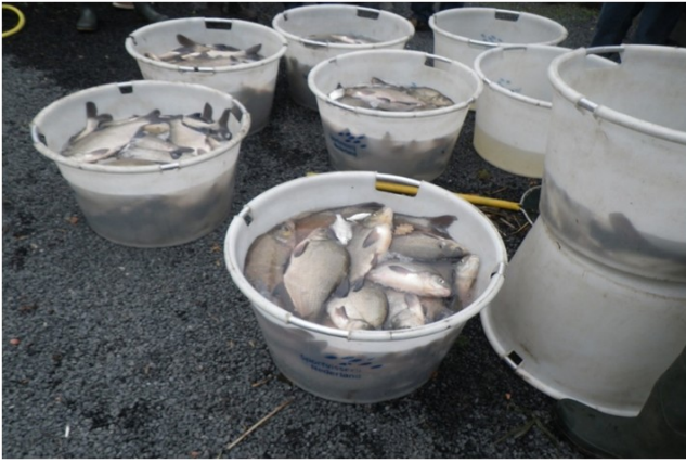
Bakken vol met gezonde brasesms