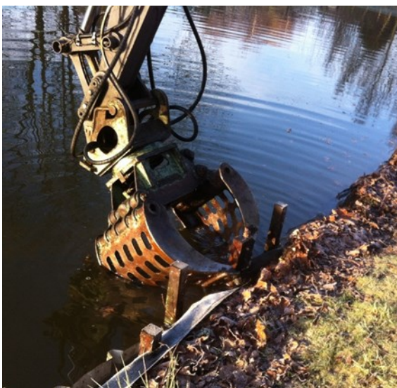
Paal en plaat samen naar beneden

Op vrijdag 18 januari komt bedrijf Baars uit Nieuwland met Jos op de trekker en de kraan, om ons te helpen bij de werkzaamheden. Eerder die week hebben we al twintig lange hardhouten palen gehaald. Om 9 uur draait de kraan en worden de palen soepeltjes in de grond gedrukt. Het aandrukken van de metalen platen gaat wat lastiger, ze willen nog wel eens de verkeerde kant op buigen.