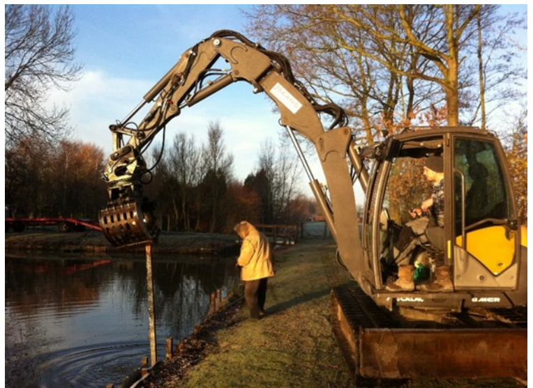
Koos heeft van tevoren bepaald waar de palen moeten komen.