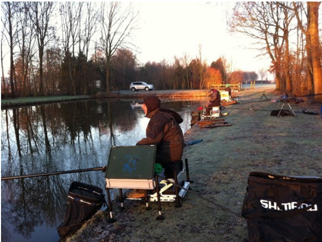
3 deelnemers in een koude karpervijver (en geen vangst)

We hebben een bewogen tijd achter de rug. In de vorige nieuwsbrief moest ik het overlijden van Wim Sloeserwij melden. Op 14 januari 2019 is onze oud-voorzitter en erelid Jan de Gier overleden. In deze nieuwsbrief is een "in memoriam" te lezen.