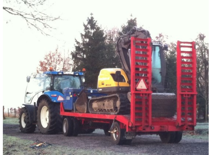
Kraan op de aanhanger, eerst koffie!!