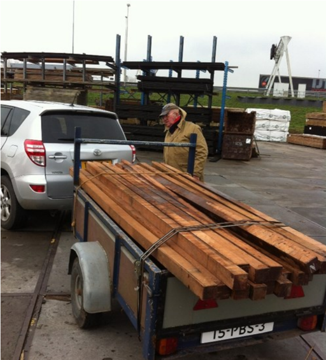
Hardhouten palen bij houthandel "Gorinchem"

In het kader van "natuurvriendelijke oevers" zijn we begonnen aan de aanpassing van de Kleine Put. Op verzoek van de karpervissers gaan we dit combineren met steigertjes voor de wedstrijden.