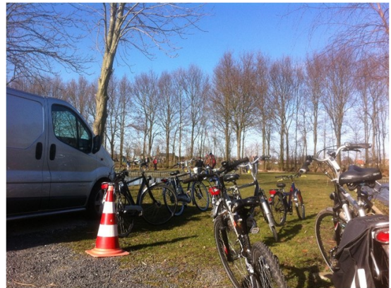
De kinderen zijn gearriveerd, fietsen op de put.