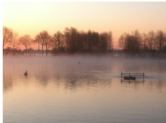
Zuurstof inpompen in het ochtendlicht