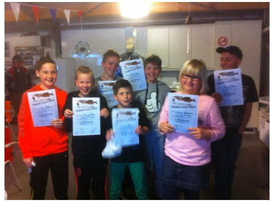
Alle kinderen kregen een diploma