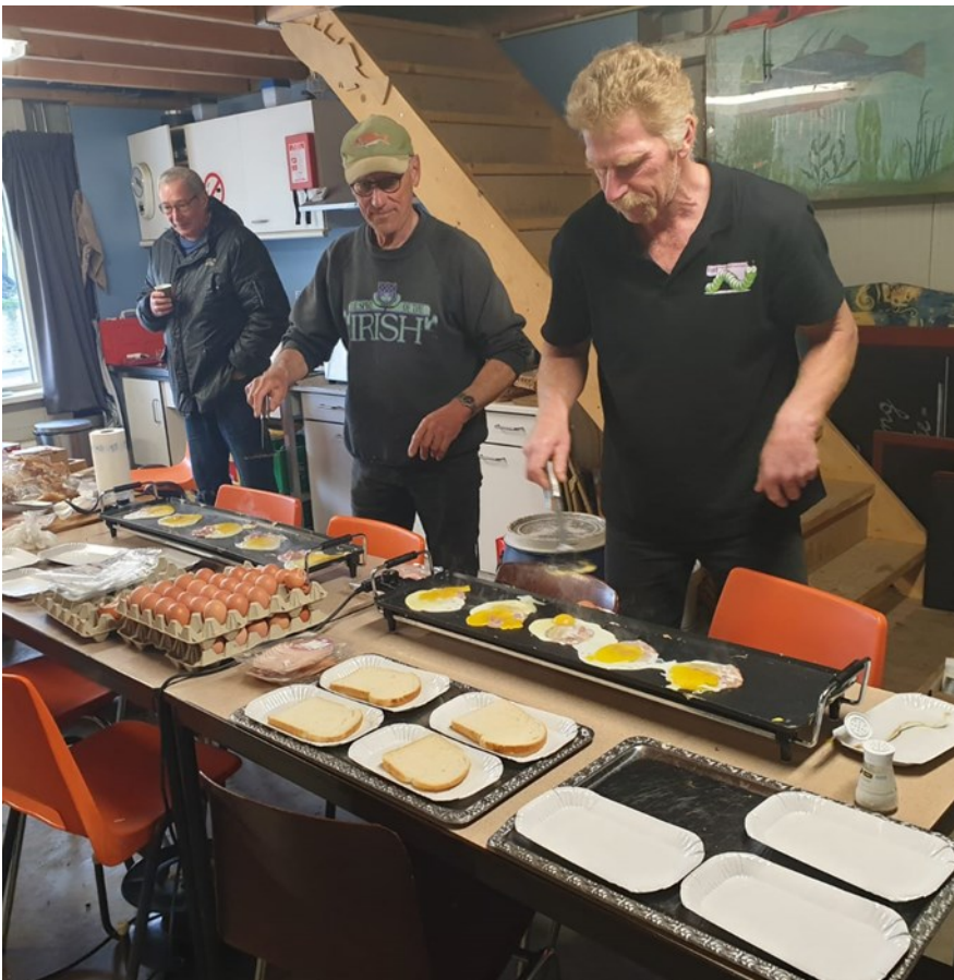
secretaris, voorzitter en penningmeester aan de slag !!