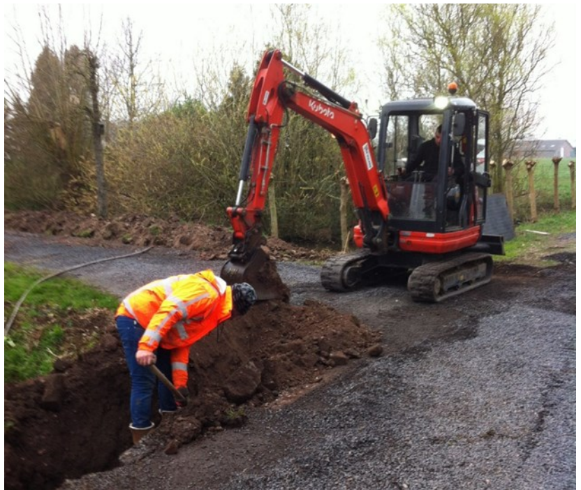
Vader en zoon Mellema in actie

In de loop van de zaterdagochtend was de geul gegraven en werd de kabel in lussen naar zijn eindbestemming geleid. Het werd nog even spannend of de kabel wel lang genoeg was. In eerste instantie was de kabel gemeten door Floris met een loopwielletje en hij schatte de lengte op 327 m. Samen met Gerrit is dit met het meetlint nagemeten en we kwamen op 337 m. In overleg met Ricardo besloten we de oude kabel niet op te graven (te veel kans op breuk) en de kabel over een nieuw tracé te laten lopen langs de sloot. Daarvoor moesten we twee keer de weg over, dus bestelden we 342 m. Toen op maandagochtend Floris de kabel kwam aansluiten zei hij "te kort". Bij nader inzien bleek de kabel nét lang genoeg, een zucht van verlichting ontsnapte!!