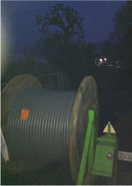
Kabel in het donker

graafwerkzaamheden, de actie is daarmee geheel legaal!!