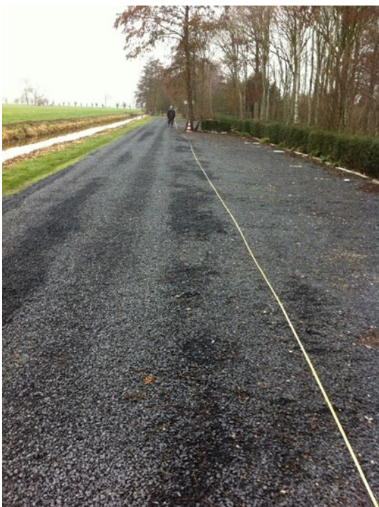
Lengte meten met het lint

In twee uurtjes had Floris de kabel gekoppeld en voor de test schakelde hij twee frietpannen in. De spanning bleek inderdaad terug te lopen tot 218 Volt. Dat is ruim voldoende om alle elektra in het clubgebouw goed te laten werken. Na een weekje konden we vaststellen dat ook het terugleveren op gang was gekomen. We gaan de komende weken scherp in de gaten houden hoe het gaat met stroom gebruiken en stroom terugleveren, want ondertussen kregen we van de energieleverancier een naheffing van bijna € 800. We hebben een flink aantal jaren probleemloos gebruik nodig om onze investering terug te verdienen.