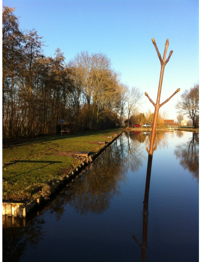
Nieuwe boom bij de kleine put, nieuwe steigers al zichtbaar!!

het voorjaar alles er weer pico bello uitziet. De natuur kan dan weer ongebreideld zijn gang gaan en de vissers genieten met volle teugen van de prachtige vegetatie rond de vijvers. Jaarlijks moeten de perenbomen langs de PietdeVrieslaan met de hand gesnoeid worden. Dirk heeft