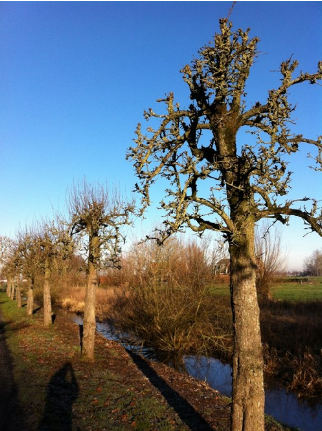
Voorste boom is gesnoeid, het rijtje erachter moet nog, maar is inmiddels gedaan !

Rond de vijvers van HSV 't Stekelbaarsje wordt zomer en winter hard gewerkt om ervoor te zorgen dat in