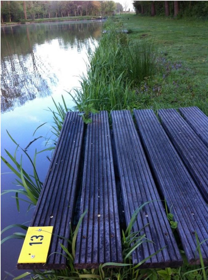
natuurvriendelijke oevers: schitterend !!

Inmiddels is dat aardig gelukt en na de eerste maaibeurt kun je al bijna niet meer zien dat er aanvulling van gras heeft plaatsgevonden. Koos heeft ondertussen de steigers van een extra lange planken voorzien, waardoor de karpervissers ook hun "zijpoot" op de steiger kunnen parkeren. Gerrit en Joop hebben een monnikenwerk verricht door slootmateriaal met schop en kruiwagen te verzamelen en in de kant boven de metaalplaten te plaatsen. Het ziet eruit alsof het nooit anders is geweest! We zijn benieuwd welke "wilde" planten straks in de waterkant tevoorschijn komen.