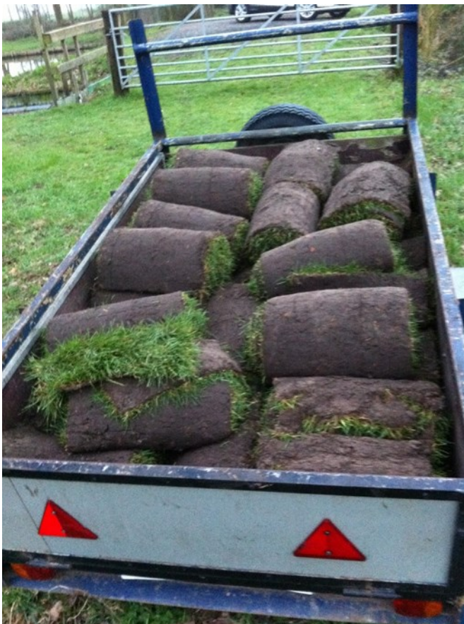
Koos heeft een karretje graszoden gehaald

Op de dag dat langs het pad de kabel werd ingegraven zijn Koos, Gerrit en Joop actief geweest met het opknappen van de wallekant rond de steigers. De zoden zijn netjes achter de nieuwe steigers gelegd en dagelijks van water voorzien om te zorgen dat het gras aan zou slaan.