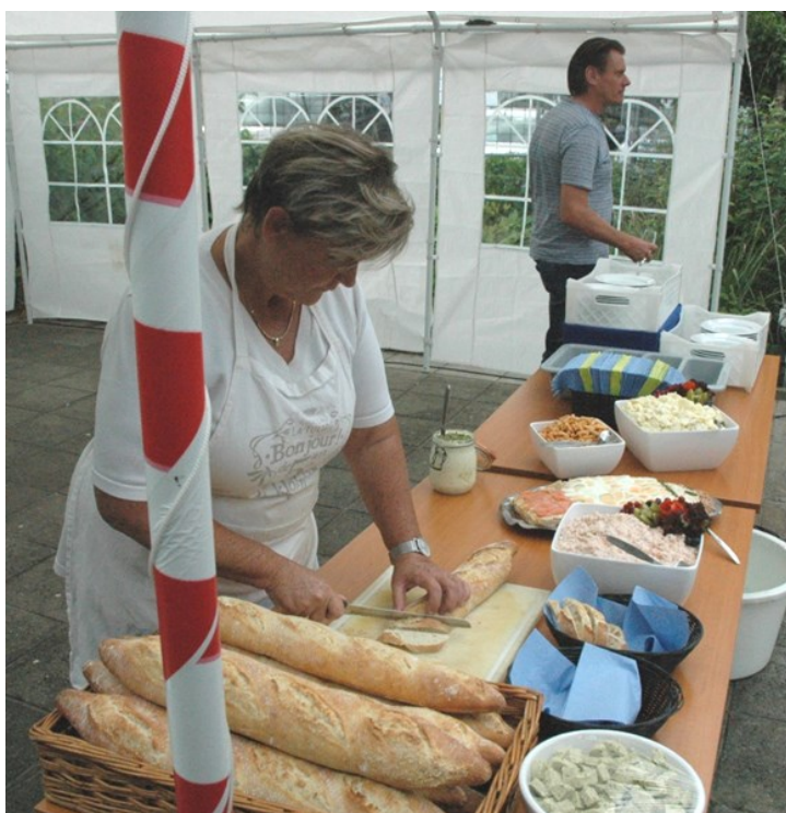
Gera in actie