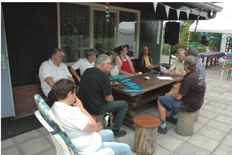
organisatieteam in vergadering

Zaterdag 27 augustus was het zover... Na een coronacrisis van bijna 2 jaar mochten we dan weer bij elkaar komen voor het vieren van een feestje !! Ongeveer 80 mensen namen de moeite om naar de