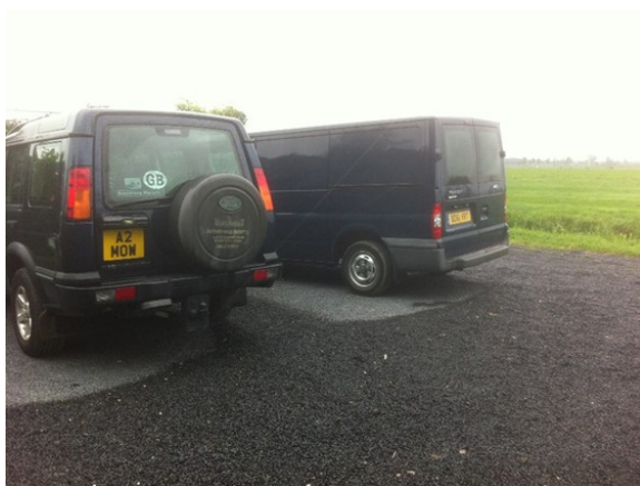
Zelfs Engelse recreanten op de put !