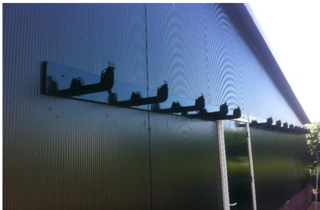
De "special-made" hulpstukken