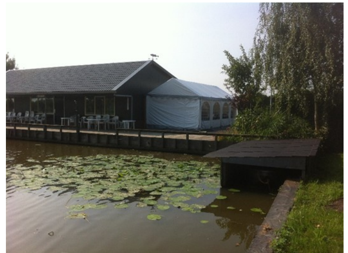
De tent naast het gebouw.

Met de nieuwe tent is Putzicht een nog betere locatie geworden voor leuke feestjes! Het gebouw kan door leden van de club gebruikt worden voor een zelf georganiseerd feestje. De datum kan alleen worden vastgesteld in overleg met Arie de Koning die de agenda beheert. Het gebruik van het gebouw kost € 130,- en voor de tent vragen we een vergoeding van € 20,-