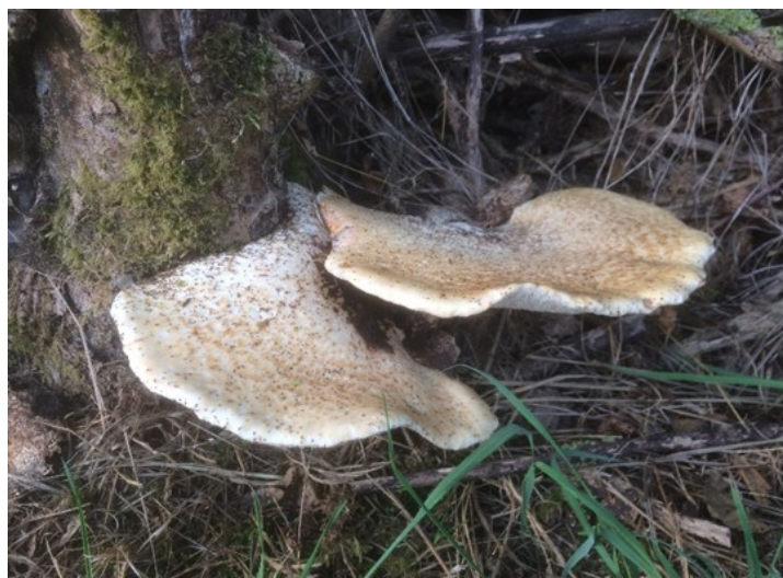
Mooie paddenstoelen rond de put