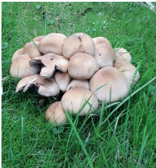
Vorige week

Ondertussen kan de natuur ook zonder hulp, want de paddenstoelen doen het geweldig. Een rondje om de put levert zo een aantal plaatjes op van schitterende composities: