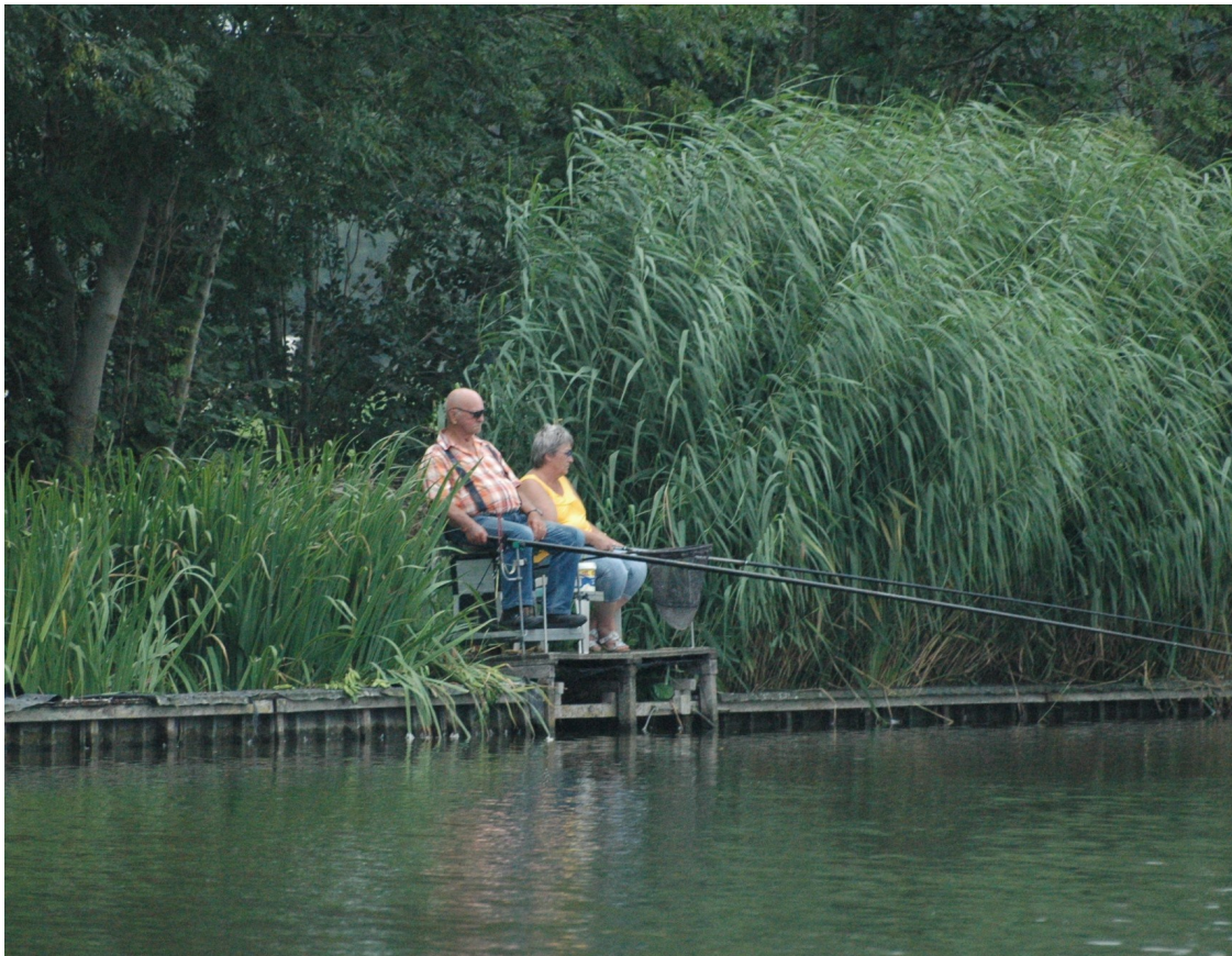
Koos en co.