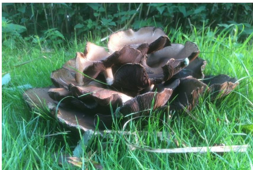
Deze week dezelfde paddenstoelen