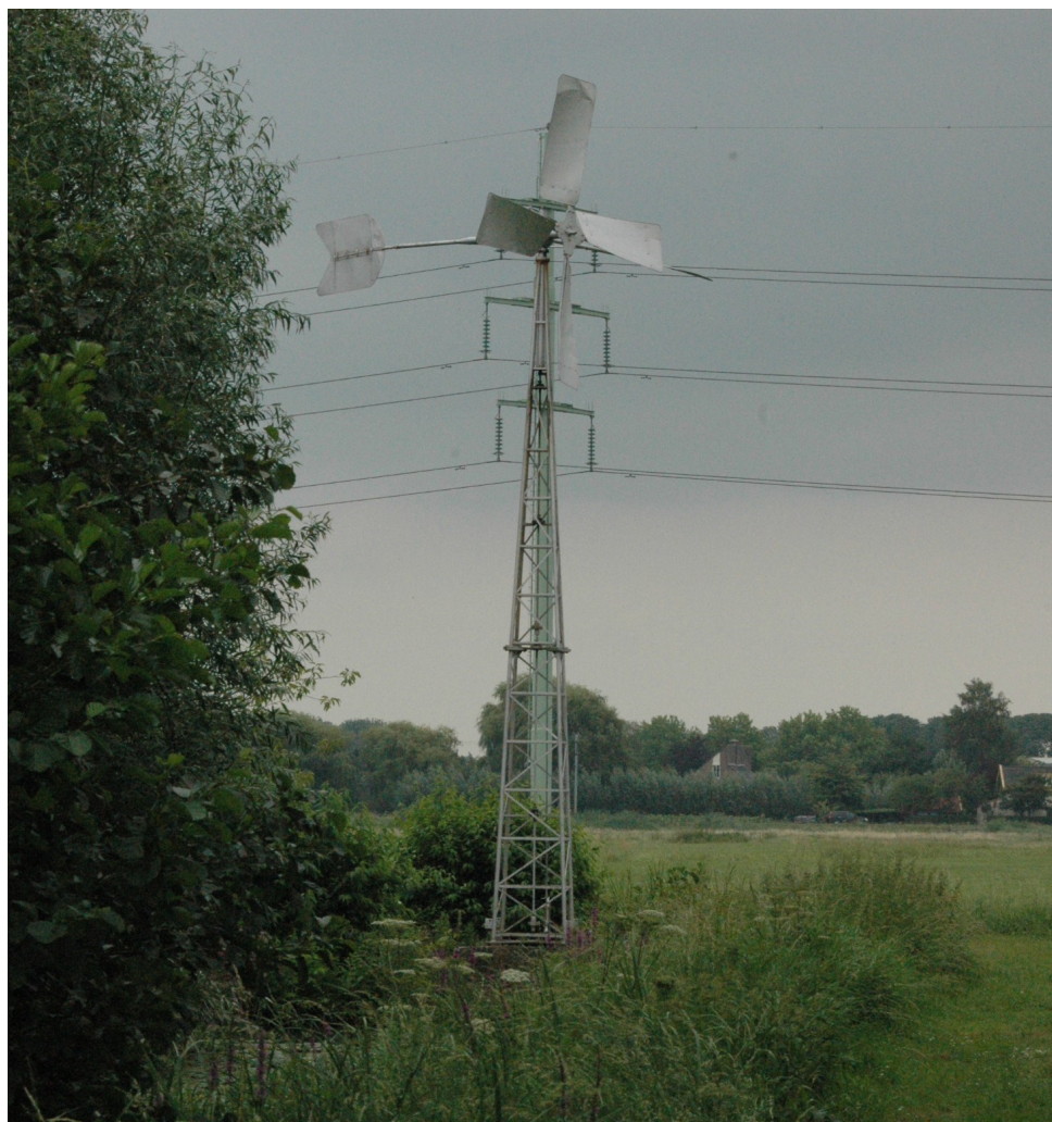
Hebben de ze nou de hoogspanningsdraden aan de molen vastgemaakt?