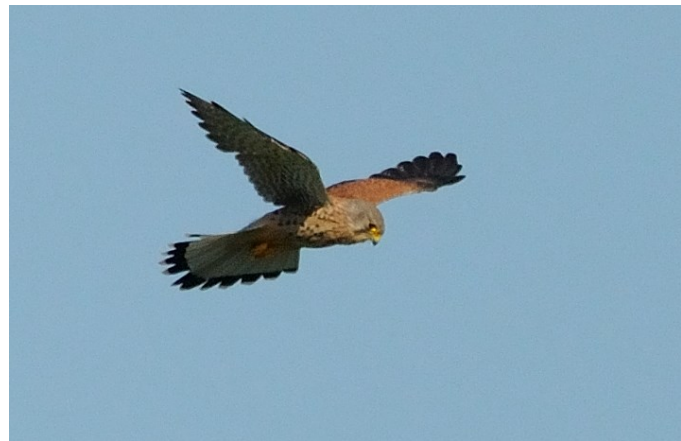
Een biddende torenvalk

In de weilanden rondom de visput is er voor de torenvalk meer dan genoeg eten te vinden!