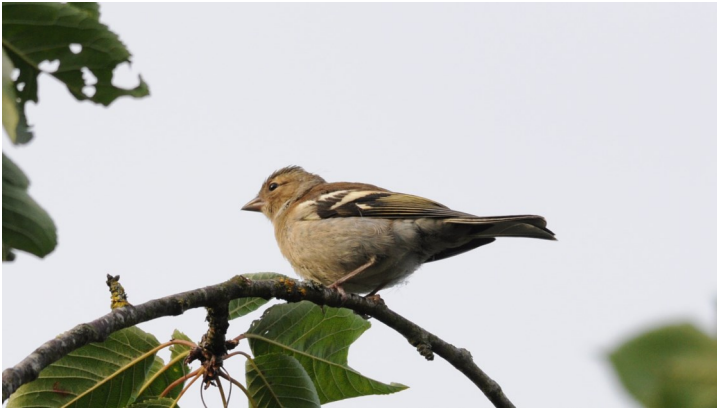
Mevrouw vink in de boom...

In deze nieuwsbrief twee nieuwe vogels: de vink en de torenvalk!