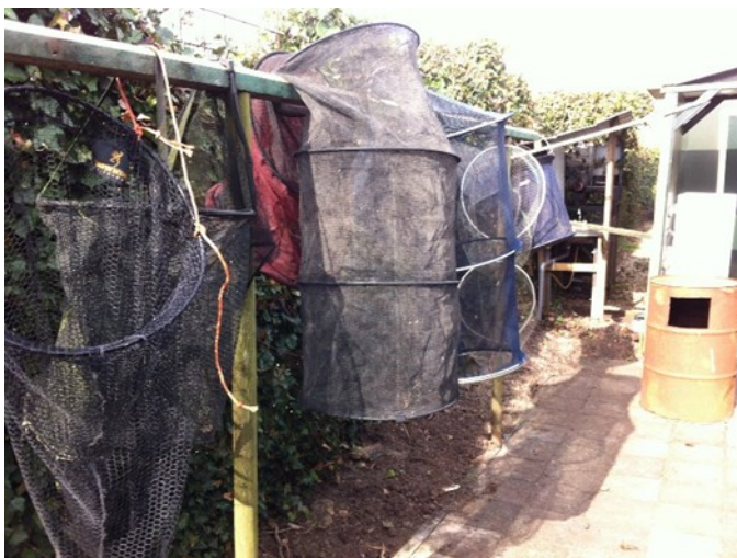
Netten laten drogen