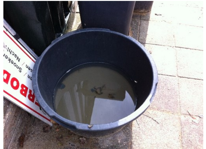
Speciekuip met citroenzuur, netten spoelen en laten drogen, doodt schimmels en ziekteverwekkers.