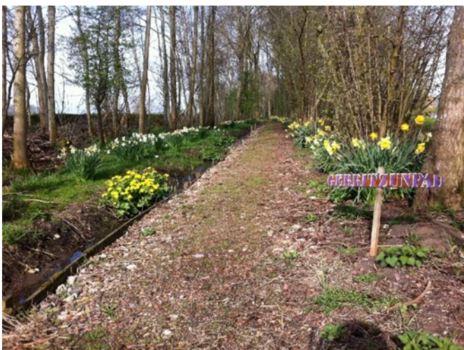
Gerrit zijn pad, een lust voor het oog !