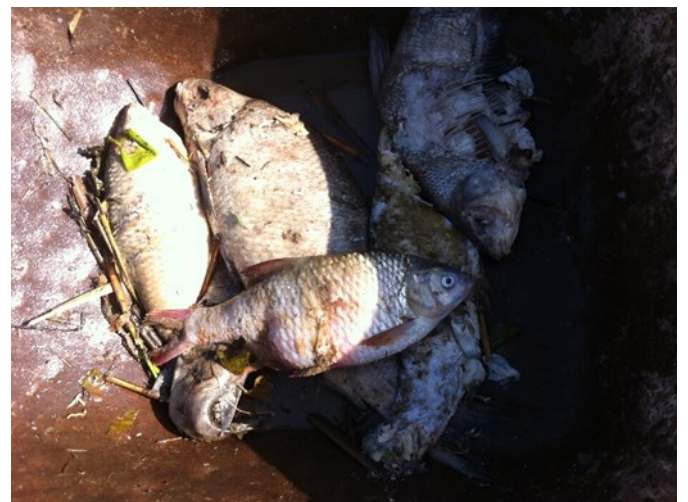
Ieder voorjaar dode vissen, gelukkig tot heden niet extreem