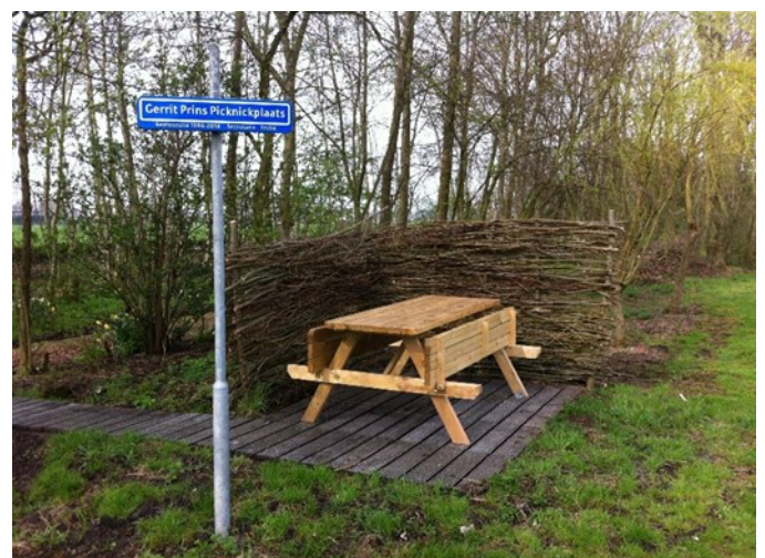
Gerrits picknickplaats, wordt al volop gebruikt.