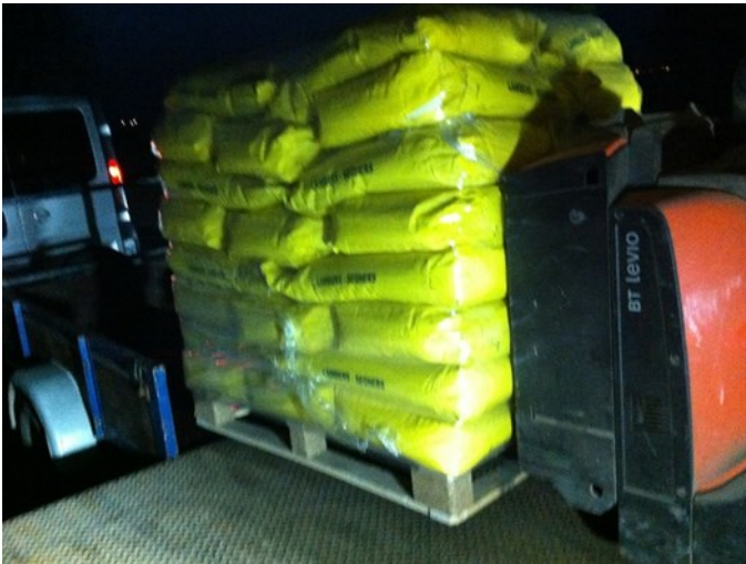
12 april, 's morgens kwart voor zes werd 1000 Kg voer uit België bij ons gebracht