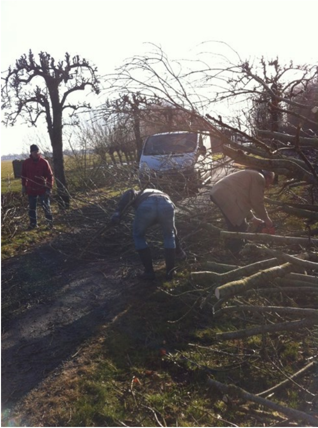
Bomen van buurman worden geruimd.