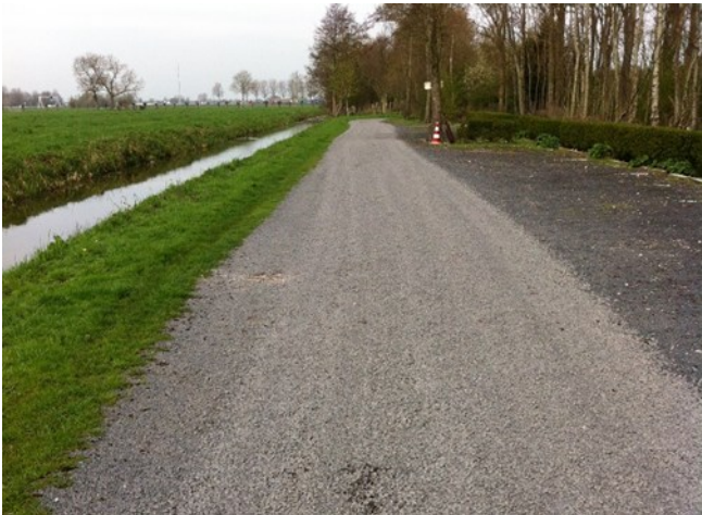
De Piet de Vrieslaan is voorzien van nieuw grind