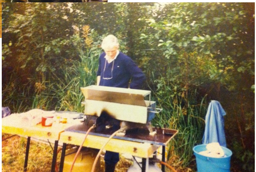
Vis bakken in zelf ontworpen bak-inrichting ....