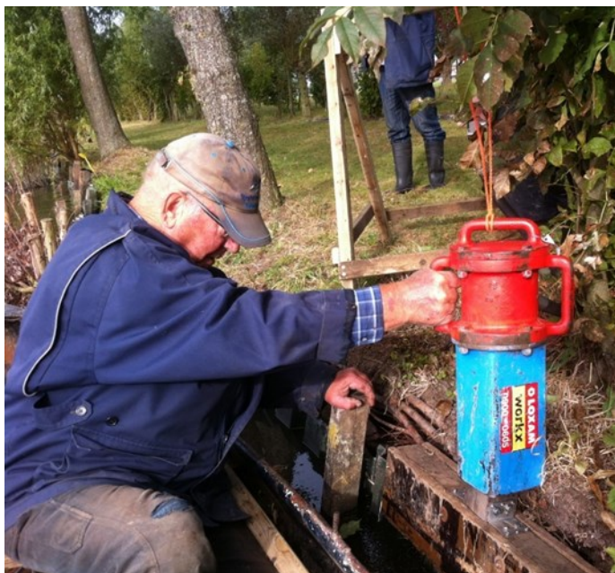
Koos voor alle timmerwerk

Het Stekelbaarsje komt regelmatig in het nieuws en in de krant staan de leden die de wedstrijden winnen. Maar voor een succesvolle hengelsportvereniging met eigen clubhuis en viswater komt véél meer kijken dan het organiseren van hengelvijdsporten! Onze vaste werkers aan de put: