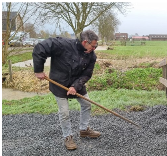
Teus voor de mooiste tuin !!