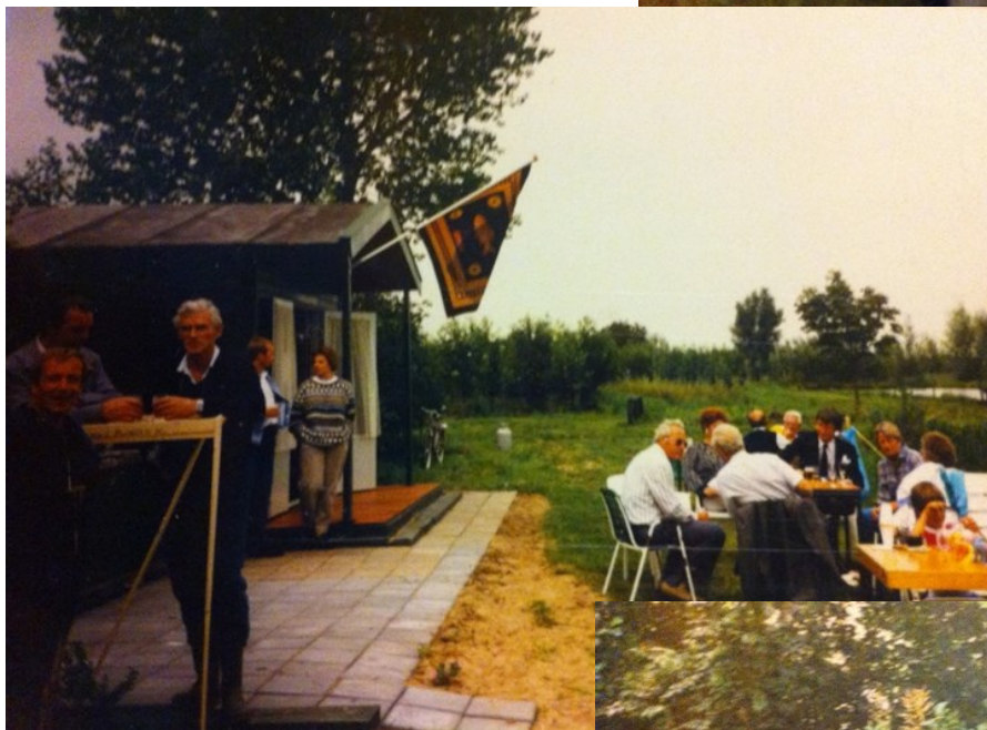
Feestelijke opening van "Ons Domeintje" Het allereerste clubhuis....