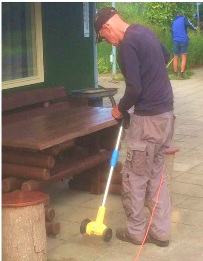
Cees bedreigt de grassprietjes tussen de tegels