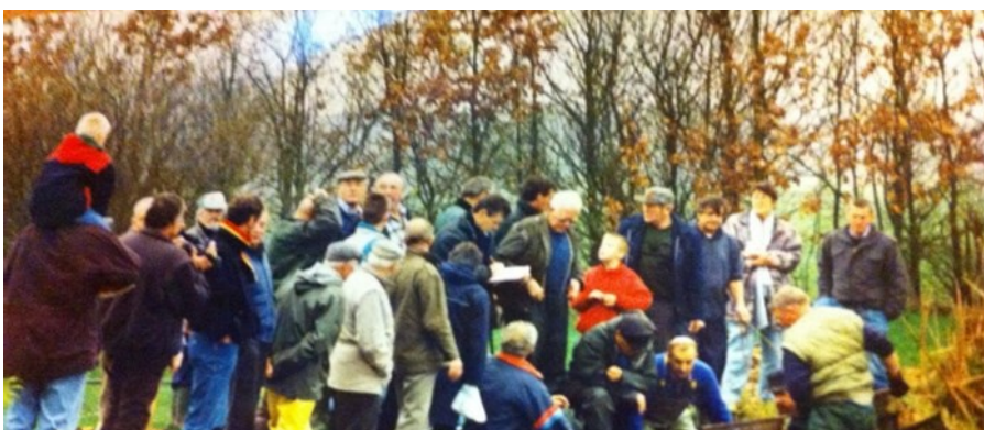
“Afvissen” van de Put.