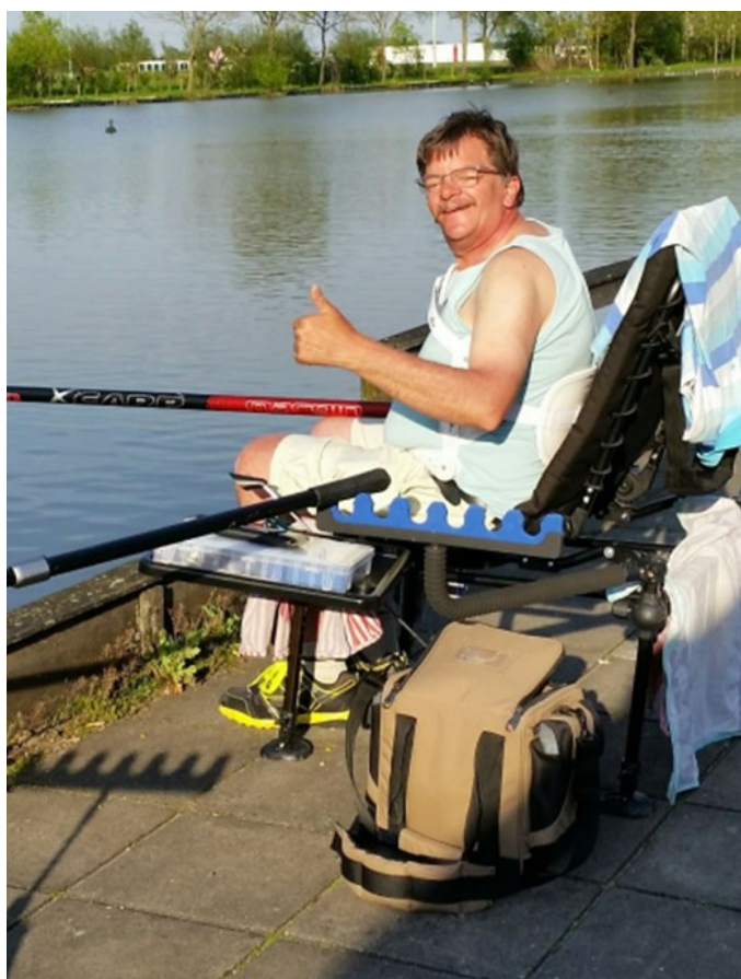
Eddy 2 e penningmeester en het gebouwbeheer