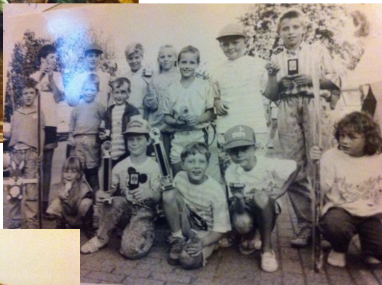
Deelname aan de dorpsoptocht..