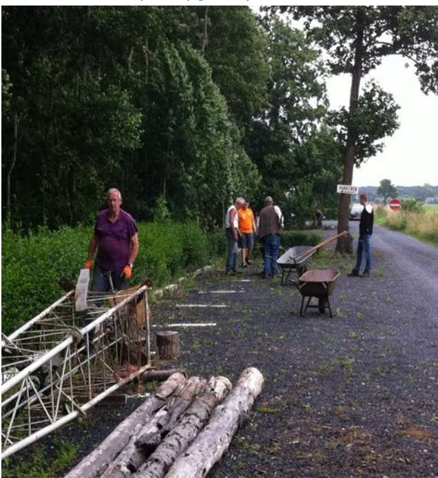
Gras tussen de steentjes uithalen