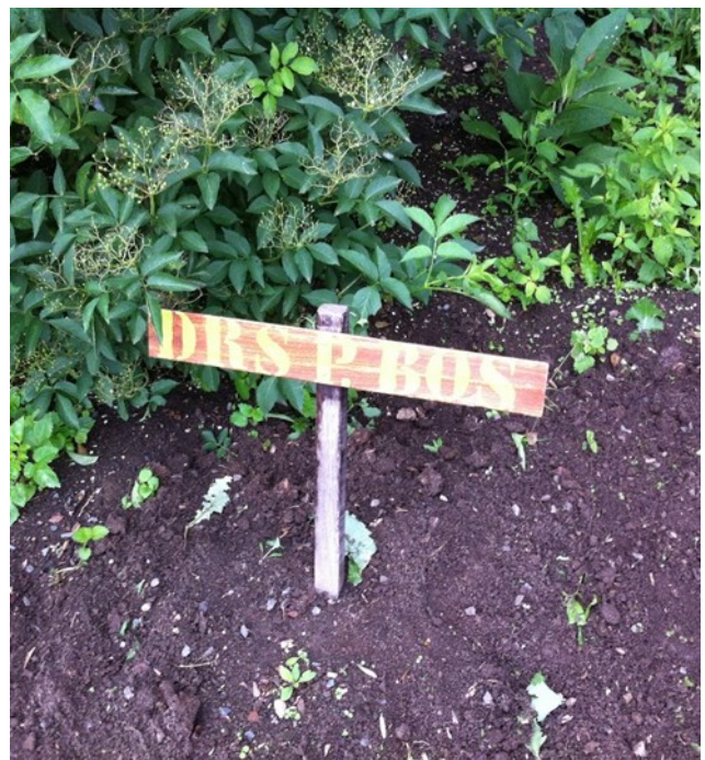
Onkruid verwijderd uit het Drs P. Bos

En zo is er altijd wat te doen !!!! Als vrijwilliger meewerken??? Kom vrijdagochtend naar de put !