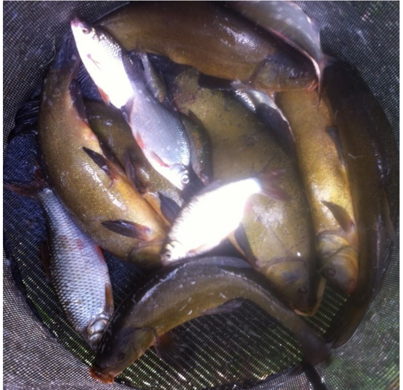
Net van 1 visser bij het testvissen: 6 zeelten !

Halverwege die periode gaan we met de woensdagclub "testvissen".