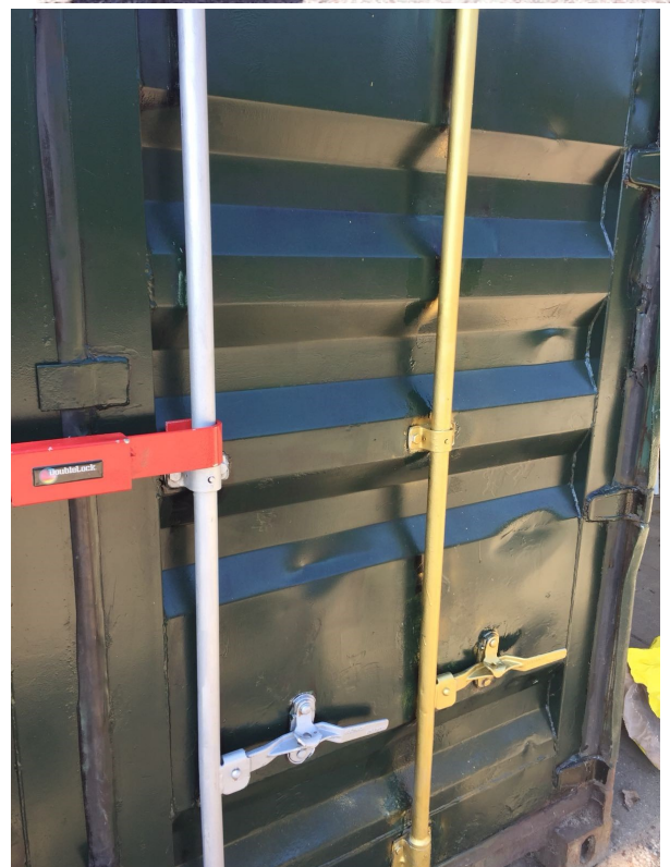
koos gaat voor goud

wist u dat.....we op zoek zijn naar kandidaten die deze veren verdienen om ergens in te steken?