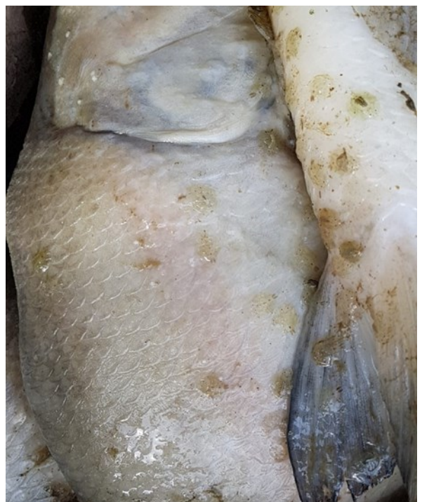
karperluis op dode brasems

Ondertussen begonnen we steeds meer dode brasems uit de grote put te verwijderen. We schrokken daar in eerste instantie niet van, ieder voorjaar vinden we ook in de vrije natuur dode vissen. In de laatste week van april werd het echter zo erg dat we Mark Breedveld opnieuw hebben ingeschakeld. Hij constateerde direct "karperluis" een vervelende parasiet die zijn slachtoffer pas loslaat als deze dood is.