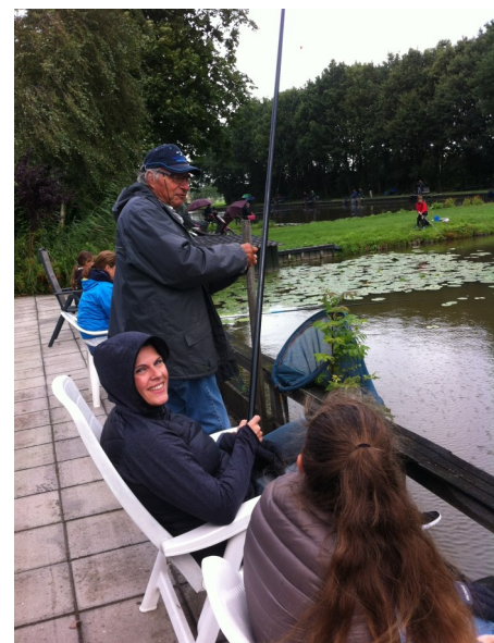
Familie De Vries vol in bedrijf