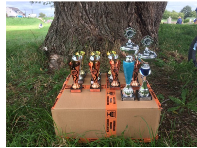
De foto's Jeugdwedstrijd Arkel 1035 op deze link is https://hsvstekelbaarsjearkel.mijnhengelsportvereniging.nl/foto-s/7557/jeugdwedstrijd-arkel-1035.html

Nieuwsbrief rechtstreeks ontvangen ?? mail naar stekelbaarsjearkel@gmail.com Onder vermelding "nieuwsbrief"