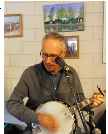
zelf voor muziek gezorgd

Het kan niemand ontgaan zijn dat dit jaar het 70-jarig jubileum van 't Stekelbaarsje werd gevierd. De receptie werd gehouden op 30 september in het Clubhuis. We wilden een feest in de geest van de verenigingsmentaliteit: "doe maar gewoon, da's gek genoeg". Met elkaar hebben we zelf voor eten, drinken, rondleidingen en muziek gezorgd.