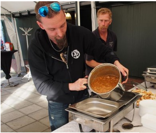
zelf voor eten gezorgd

Het kan niemand ontgaan zijn dat dit jaar het 70-jarig jubileum van 't Stekelbaarsje werd gevierd. De receptie werd gehouden op 30 september in het Clubhuis. We wilden een feest in de geest van de verenigingsmentaliteit: "doe maar gewoon, da's gek genoeg". Met elkaar hebben we zelf voor eten, drinken, rondleidingen en muziek gezorgd.